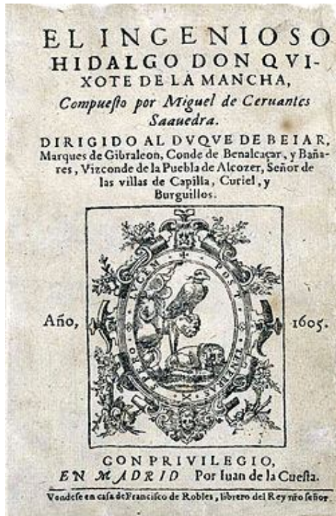
Primera parte del Quijote de Cervantes-1605